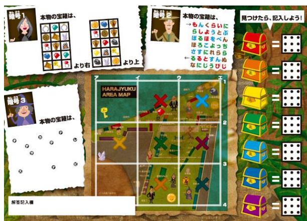
会場内を楽しく巡ることができる宝の地図(参加冊子)

宝の地図(参加冊子)や世界観設定にテレビ東京のキャラクター・バナナ社員「ナナナ」を起用したリアル宝探しは、会場内に実際に隠された7つの宝箱の中から、たった1つのホンモノを見つけ出すゲームです。難解な暗号を解くことができれば、ホンモノの宝箱の在り処を見つけ出すことができます。また、見事正解した方の中から抽選で「58V型4K対応液晶テレビ」や「松阪牛5kg(10万円相当)」など豪華賞品をプレゼントします。