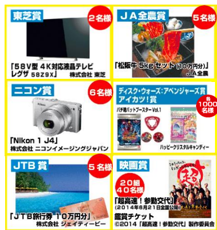
正解者の中から抽選で当たる豪華賞品一例