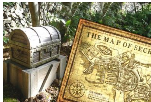
クオリティにこだわった宝箱と宝の地図