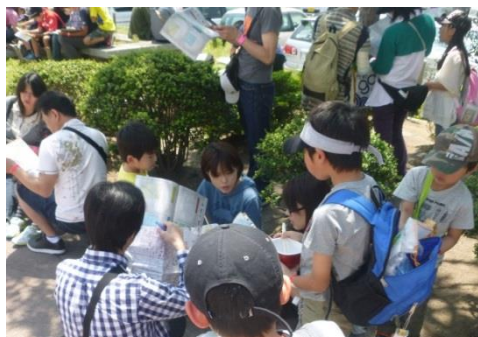
大人も子供も夢中になって宝の地図の暗号を解読

観光地やテーマパーク、ショッピングモールなどの店舗で遊べる、参加型の宝探しイベントです。参加者は宝の地図（参加冊子）を入手し、描かれた謎を解き明かし、隠された手がかりをみつけながら、最終的に「宝物」を発見します。宝物捜索の間に触れる、観光地の名所や、隠れスポットや、お土産屋さんの店主との会話など、自分だけの発見を楽しみながら参加いただけます。